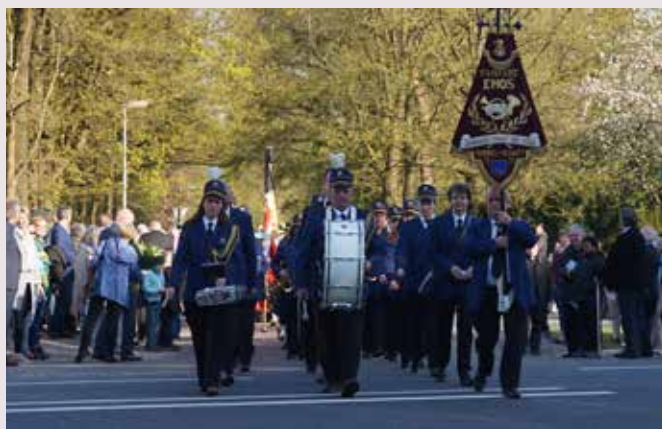
De fanfare van EMOS gaat de stoet voorop.

Om 18.20 uur exact vertrekt een touringcar vanaf de Markt in Valkenswaard naar de Britse begraafplaats aan de Luikerweg. Om 18.35 uur vertrekt een stille