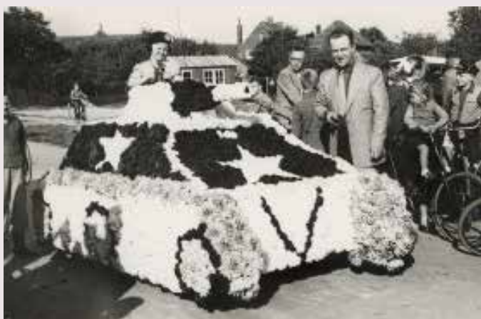
Een foto uit de oude doos van de Corso.

De stichting Bloemencorso Valkenswaard is ontstaan naar aanleiding van de bevrijding van Valkenswaard op 17 september. Het bloemencorso gebruikt daarom nog altijd de dahlia als bloem omdat deze in september op de velden in bloei stond ( https://www.oncorso.nl/historie.html ). In december 2021 is onder andere de stichting Bloemencorso Valkenswaard op de UNESCO erfgoedlijst gekomen. Reden voor het