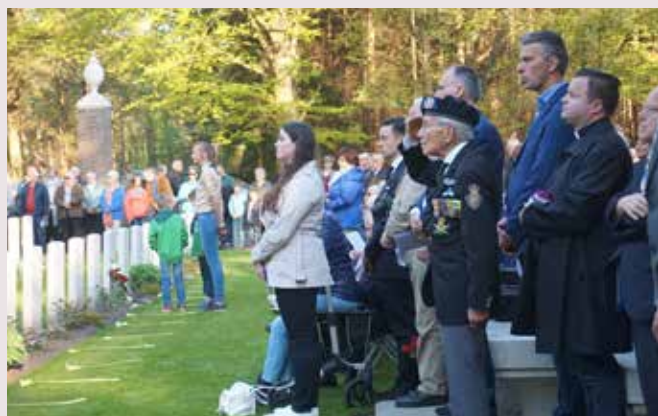
Een drukke herdenking voor de Corona pandemie.

Op 4 mei houdt Waalre de traditionele dodenherdenking bij het beeld 'Bevrijding' in het plantsoen aan de Iman van den Boschlaan. Waarnemend burgemeester Boelhouwer opent de herdenking om 19.44 uur met een toespraak, gevolgd door een muzikaal intermezzo en het blazen van de Taptoe. Om 20.00 uur is er twee minuten stilte. Daarna leggen aanwezigen bloemen bij het beeld. ●