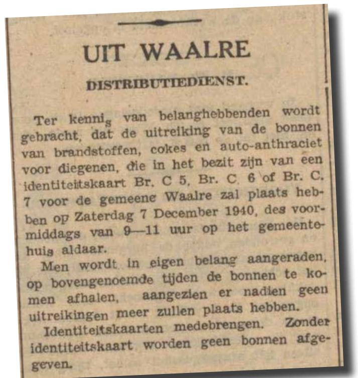
Artikel uit de Eindhovensche en Meijerische courant 4 december 1940

Al voor de inval van de Duitsers werd op 11 oktober 1939 in Nederland suiker alleen maar verkrijgbaar met een bon. In januari 1940 volgde hierop de erwten. Na de inval van de Duitsers en naarmate de oorlog voortduurde gingen steeds meer producten op de