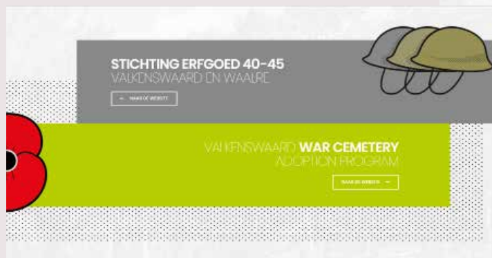
Screenshots van de nieuwe website.

De hoofdreden om de vragenlijst te versturen was om het adresbestand van de adoptanten weer up to date te krijgen. We hadden het gevoel dat we enkele adoptanten niet konden bereiken waardoor de communicatie niet optimaal was. Daarnaast wilden we van de gelegenheid gebruik maken om wat feedback op te vragen over onze werkzaamheden, om te zien of er nog verbeterpunten kunnen worden aangebracht.